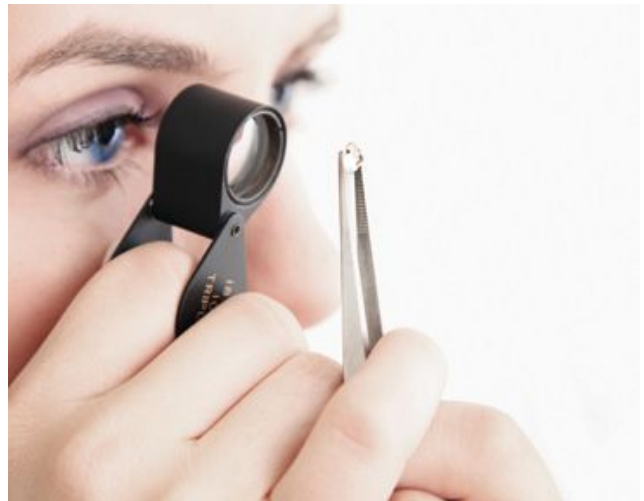
鑽石分級實習班學生使用 10 倍珠寶放大鏡評估鑽石的淨度