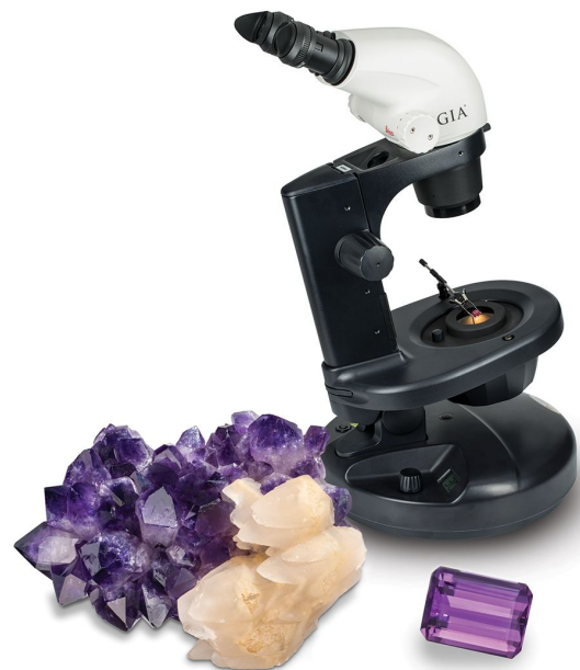
GIA顯微鏡、紫水晶原石及刻面寶石